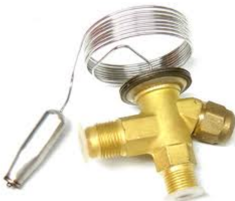
Válvula de expansión termostática