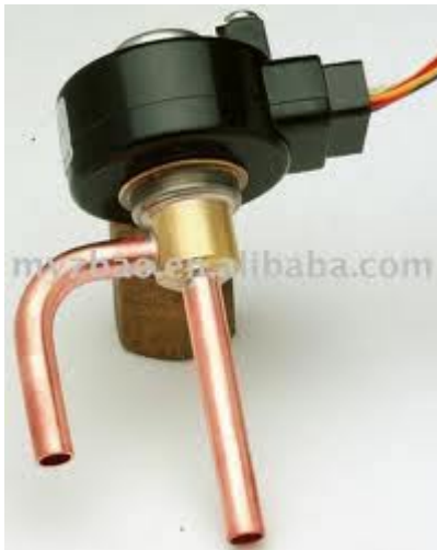
Electrovalvula de expansión